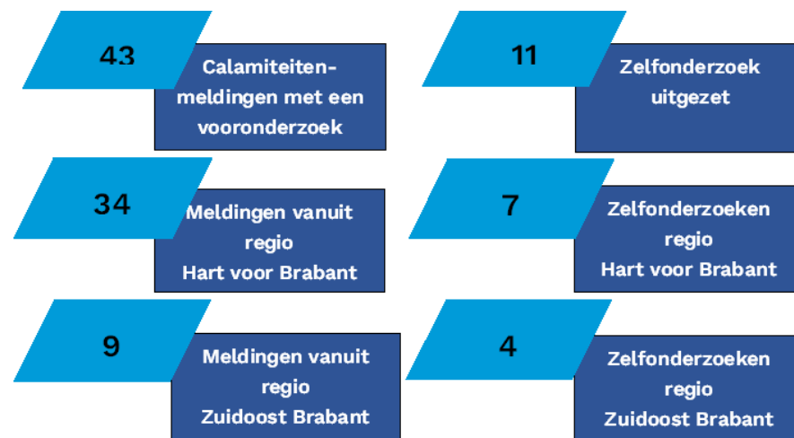
Figuur 1 Overzicht van het aantal calamiteiten in 2023

Daarnaast voert de GGD dit toezicht uit voor vier gemeenten buiten het werkgebied, omdat deze samenwerken met onze gemeenten. Sinds 2023 is ook het toezicht door 21 gemeenten in de regio Zuidoost Brabant bij GGD Hart voor Brabant belegd. In totaal gaat het om 44 gemeentes.