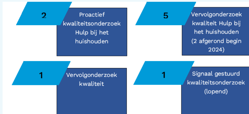
Figuur 2 Overzicht van het aantal kwaliteitsonderzoeken