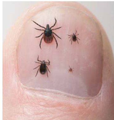
Een duimnagel met daarop vier teken.